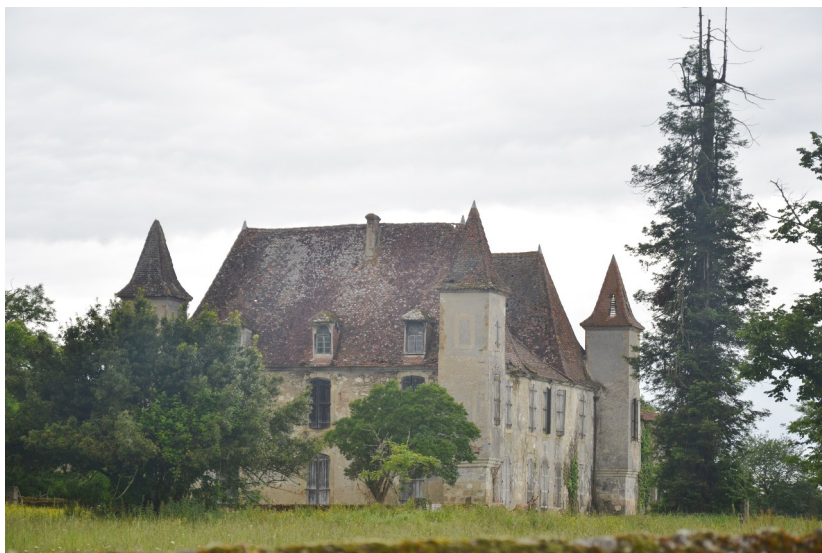
Le château de Cahuzac sur Adour

Si ceux qui possèdent un bien, si petit soit-il, peuvent l'affermier, l'immense majorité des habitants n'ont à offrir que leurs bras. En cas de mauvaises récoltes, ils s'endettent mais sont si pauvres qu'ils savent qu'ils ne pourront jamais rembourser.