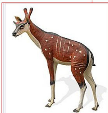
Ampelomeryx ginsburgi reconstruction 3D grandeur nature

Partez à la découverte de l'Ampelomeryx lors d'une visite guidée exceptionnelle ! Découvert en 1987, le gisement paléontologique de Montréal-du-Gers est un des sites majeurs d'Europe et le plus important découvert en France. Il est daté d'environ 17 millions d'années. Dans le gisement, une riche faune fossile a été trouvée. Depuis sa découverte, des milliers d'os ont été dégagés : plus de 90 espèces de vertébrés ont été répertoriées.