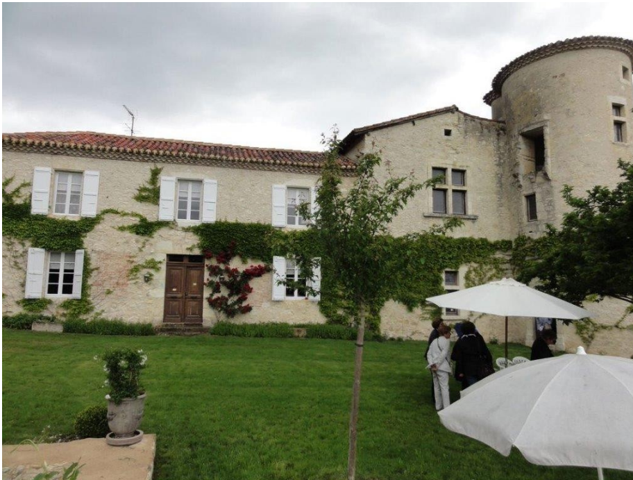
Le Pimbat Cruzalet